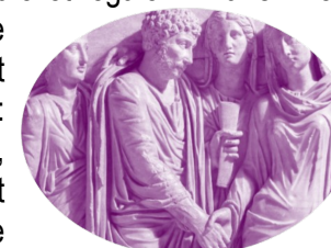
A Rome, l'union des mains. La dextrarum iunctio symbolisait l'union des époux. Bas-relief d'un sarcophage du I er siècle apr. J.-C. British Museum, Londres.

On remonte aux alentours de 2350 avant J.-C., dans l'antique Mésopotamie, avec les premières traces concrètes de cette union sacrée, gravée sur des tablettes d'argile, véritables symboles du mariage en tant qu'institution sociale et légale. Dans les sociétés anciennes, loin d'être seulement une affaire de cœur, le mariage était une affaire de survie, de pouvoir, et un pilier de l'organisation sociale, économique et politique : mariages arrangés pour renforcer les liens familiaux,