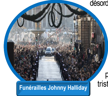
Funérailles Johnny Hallyday

Aujourd'hui, en France, sont considérés comme grand rassemblement toutes les manifestations sportives, culturelles ou récréatives ou les manifestations, susceptibles de rassembler au moins 5 000 personnes. L'histoire moderne de la France n'est pas avare de manifestations. Le peuple de France bat régulièrement le pavé de Paris et des grandes villes pour exprimer sa colère, sa tristesse ou sa joie. Parmi les manifestations qui ont rassemblé plus d'un million de personnes. Voici les plus grandes depuis 1789 .