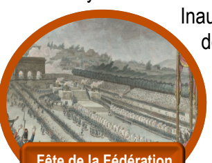
Fête de la Fédération 14 juillet 1790

Inaugurations de stèles, entrée au Panthéon, fleurissements de sépultures, minutes de silence, journées nationales ou internationales du souvenir... nous vivons en France un cycle intense de commémorations , dont certaines partagées avec les nations étrangères, alliées et adversaires d'hier, font évoluer notre regard sur le passé et éclaire le présent . Plus silencieuses, chargées d'émotion, les marches blanches ou cortège de funérailles . Ce silence peut signifier le respect, la douleur d'avoir perdu un proche, le recueillement, mais aussi la colère, la réprobation ou la gravité d'un problème réclamant des mesures d'exception.