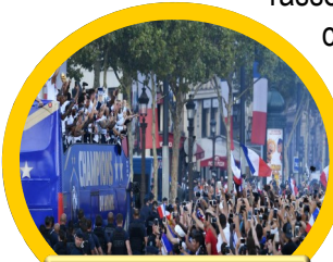
Coupe du monde 1998

s'ils donnent du plaisir aux participants et aux spectateurs, sont aussi des lieux de cohésion sociale . Le sport rassemble des personnes d'horizons, de cultures et de croyances différents qui apprennent à apprécier et à respecter. En 2015, l'Assemblée générale des Nations Unies a adopté le Programme de développement durable à l'horizon de 2030, avec 17 objectifs dont le sport. L'article 37 stipule : Nous apprécions la contribution croissante du sport au développement et à la paix par la tolérance et le respect qu'il préconise, à l'autonomisation des femmes et des jeunes, de l'individu et de la collectivité, et à la réalisation des objectifs de santé, d'éducation et d'inclusion sociale.