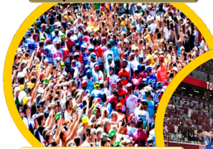
Départ Tour de France