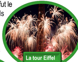
La tour Eiffel

De nombreux métiers de « l'évènementiel » ont fleuri ces dernières années, mais beaucoup de rassemblements sportifs, culturels, musicaux... reposent sur les bénévoles . Ils constituent des équipes polyvalentes prêtes à relever tous les défis : montage des scènes, organisation logistique, accueil et informations pour le public, restauration, gestion de la sécurité, et tellement plus. Pour les JO de Paris ce sont 45 000 volontaires qui ont été sollicités. Cet engagement n'est pas seulement motivé par l'amour du sport, de la musique ou le désir de soutenir les arts, mais aussi par le sentiment d'appartenance à une communauté. Leur récompense ? Des souvenirs impérissables, de nouvelles amitiés et la satisfaction d'avoir contribué à créer une expérience magique pour les autres . Le travail bénévole dans un rassemblement est une source de gratification personnelle incroyable. Les bénévoles, par leur passion et leur engagement, sont le cœur battant des rassemblements. Alors la prochaine fois que vous vous trouverez au milieu d'une foule rassemblée pour vibrer, soutenir, applaudir, chanter, prenez un moment pour remercier ces individus formidables . Car sans eux, la fête ne pourrait tout bonnement pas avoir lieu.